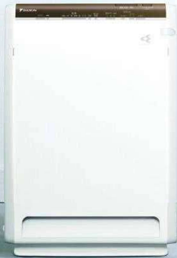
ストリーマ空気清浄機