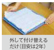
外して付け替える だけ(目安は2年)