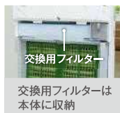
交換用フィルターは 本体に収納