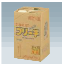
18kgタイプ (タフテナー)