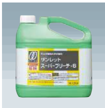
スーパーブリーチ・6

食品添加物の商品も各種 取り揃えております。 次亜塩素酸ナトリウム 6 % (上記写真) ・ 1.2% 以上