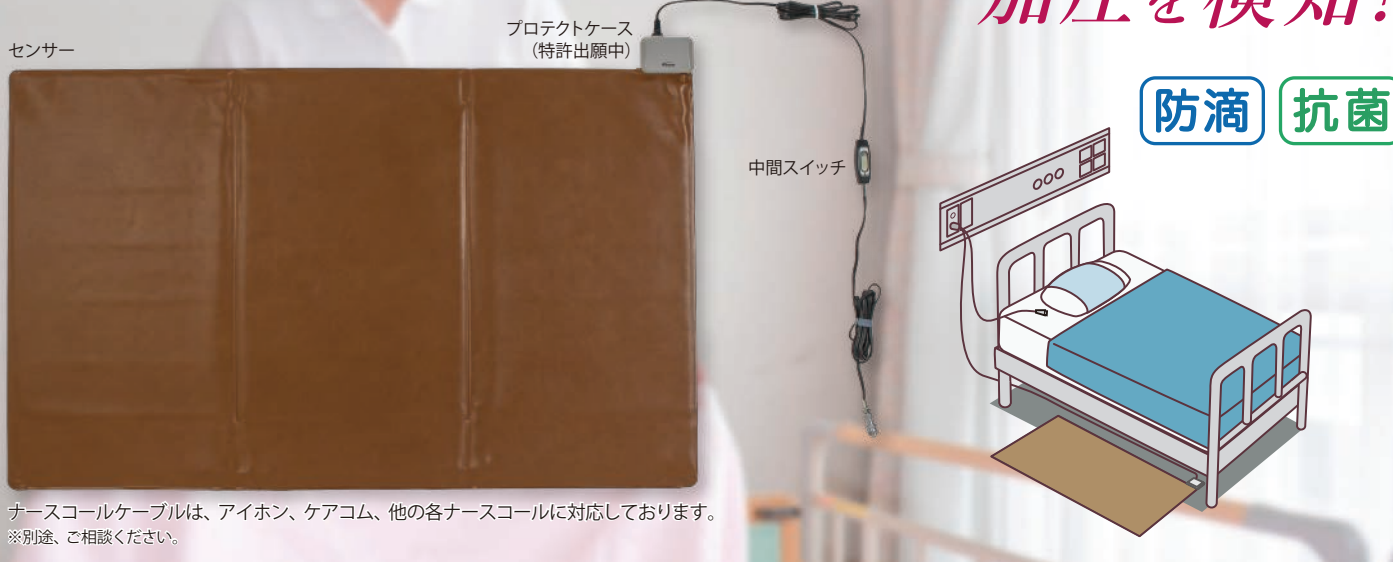
ナースコールケーブルは、アイホン、ケアコム、他の各ナースコールに対応しております。 ※別途、ご相談ください。